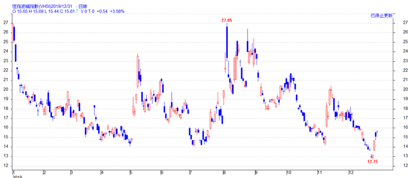
■ VHSI/恒指波幅指數（2019年1月1日至2019年12月31日）

作為一般散戶，我們可以回顧去年的 VHSI，最高 27.05，最低 12.75，全年大多數時間是在年度的中低位徘徊，是個穩中向好的年份。如本欄去年的最後一篇文章〈計恒指波幅 算期權收成〉所述：做指數期權是對每個月波幅預期的精雕細刻。因此，若能略花工夫分析月波幅，回報率就會上升。