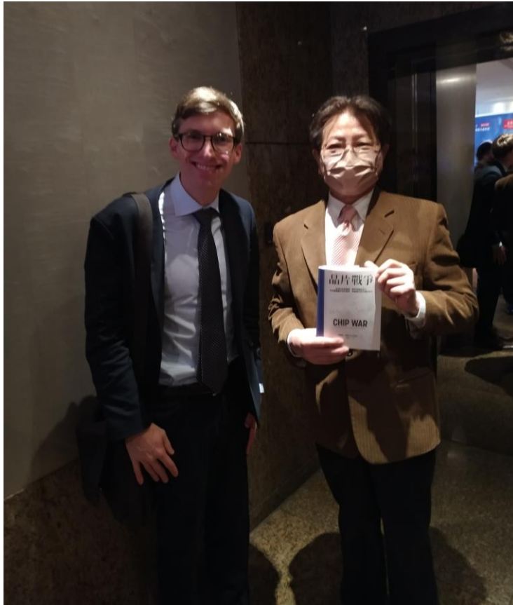
（與《晶片戰爭》作者 Chris Miller 簽書後合影）

finished this book, the game quickly changed.) 這是晶片教父邏輯清晰的言語，尊重對方之餘，也有自己一言九鼎的觀點，還留下空白讓大家思考，各位讀者可以想像當時熱烈的掌聲。筆者除了欣賞，還是欣賞，深刻地記得在《張忠謀自傳（上冊）》中，他兩次提及年輕時的夢想是當作家，看來他是了解自己具有表達藝術的能力。