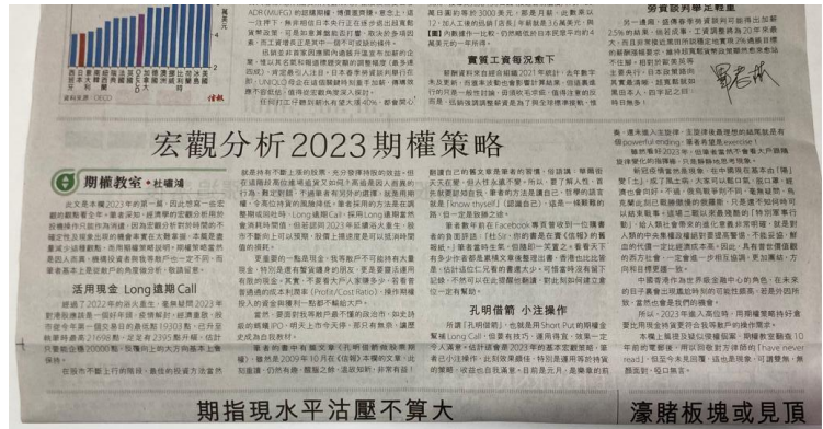
期指現水平沽壓不算大

在股市不斷上行的階段，最佳的投資方法當然就是持有不斷上漲的股票，充分發揮持股的效益。但在這階段高位進場追貨又如何？高追是因人而異的行為，難定對錯，不過筆者有另外的選擇，就是用期權，令高位持貨的風險降低。筆者採用的方法是在調整期或回吐時，Long 遠期 Call，採用 Long 遠期當然會消耗時間值，但若認同 2023 年延續浴火重生，股市不斷向上可以預期，股價上揚速度是可以抵消時間值的損耗。