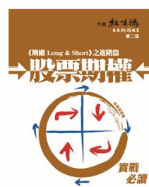
《股票期權》 HK$ 200