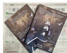
《投機者 - The Speculators》 愛情+金融 香港真人真事改編 的勵志故事-中英雙語套裝 HK$ 200