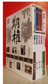
《期權五本套裝》 HK$ 1,000