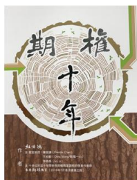
《期權十年》 HK$ 200