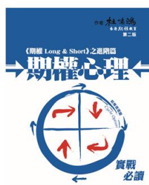
《期權心理》 HK$ 200