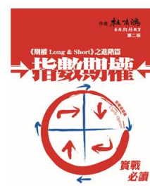
《指數期權》 HK$ 200