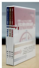
《期權三本套裝》 HK$ 600