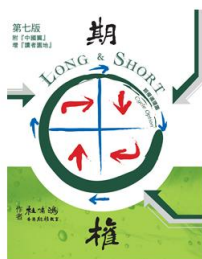
《期權 Long & Short》 HK$ 200