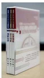
期權三本套裝——《股票期權》 《指數期權》《期權心理》 —— HK$600.00

網上書店： https://www.hkoptionclass.com.hk/bookshop