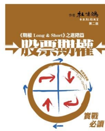
股票期權 —— HK$200.00