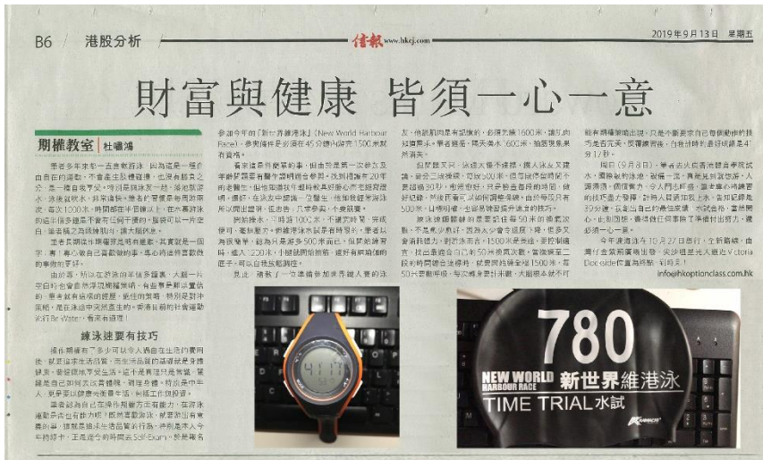
2019 年 9 月 13 日 『財富與健康 皆須一心一意』 有興趣可按上圖閱讀全文

本欄在 2019 年九月份有一篇文章題為：『財富與健康 皆須一心一意』，當時是第一次參加維港渡海泳，萬事俱備，但可惜盛事最後被取消，建議有興趣的讀者返讀該文，再看今天為完成這個故事而寫的續篇，一定會有收益。